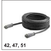
42, 47, 51