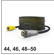
44, 46, 48-50